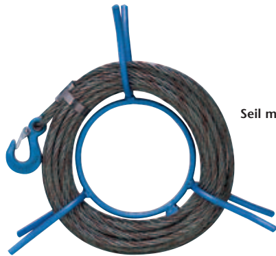
Seil mit Hand-Haspel