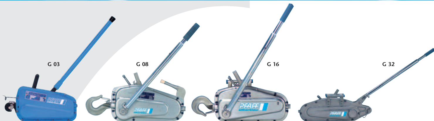
Universalseilzug PROLINE Typ G