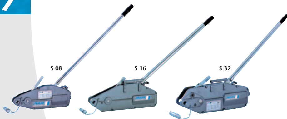
Universalseilzug SILVERLINE Typ S