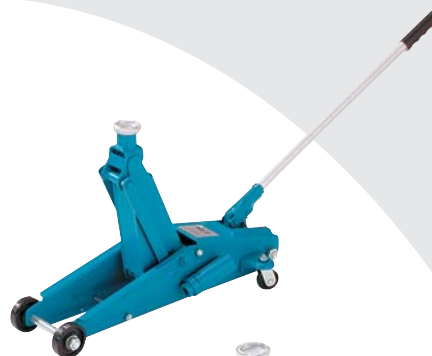
HRH S 2,5 K

Żabka warsztatowa SILVERLINE HRS S łączy w sobie funkcjonalność wraz z bezpieczeństwem i służy do jednostronnego podnoszenia pojazdów o ciężarze od 2 t do 5 t. Różne długości podwozia w połączeniu z niską konstrukcją własną umożliwiają optymalny dobór do różnych typów pojazdów, także takich o niskiej zabudowie. Pomocne detale: pompa zintegrowana z dyszlem, czuły zawór spustowy dla milimetrowej dokładności opuszczania, lekkobieżne rolki dla wygodnego pozycjonowania. Urządzenie spełnia wymogi normy produktowej EN 1494.