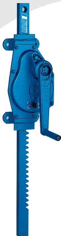
3000 – 10000 kg