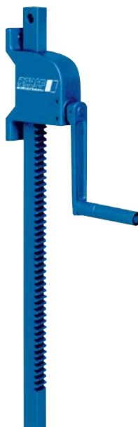
250 – 500 kg